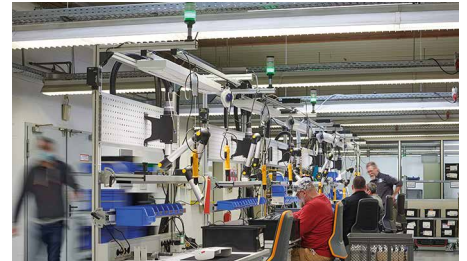
Ortsunabhängige Ansteuerung von Signal- säulen via Funk / Location-independent remote management of stack lights