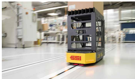
Automatisierte Warenübergabe an FTS / Automated transfer of goods to AGV