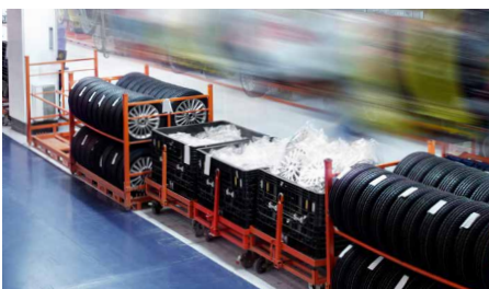
Füllstandsüberwachung von Großladungs- trägern / Level monitoring of large load carriers