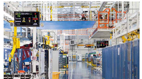
Mobile Andon-Systeme / Mobile Andon systems