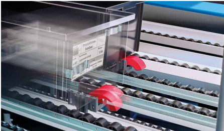
Materialbereitstellung im eKanban-Regal / Materials provision using eKanban system

Whether eKanban or Andon systems, Stack light or AGV: digitalisation is bringing profound changes to industrial workflow processes, with huge potential for optimisation. In order to help you reap maximum benefits from this development, we offer intelligent solutions with nexy, integrating process data in your IT infrastructure reliably and in real time, facilitating universal accessibility. A modular system design means that different top-quality components can be individually and even repeatedly combined. Efficient and affordable implementation of a wide variety of applications in line with your precise requirements is therefore possible.