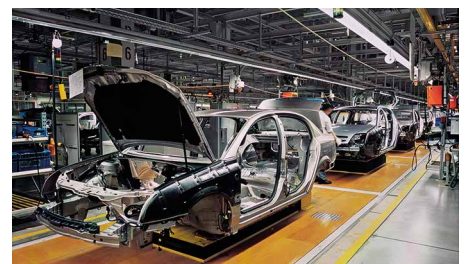
„Wake up“-Funktion für FTS im Deep-Sleep- Modus / „Wake-up“ function for AGV in deep sleep mode