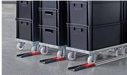
Dolly-Monitoring im Material-Supermarkt / Dolly monitoring in material supermarkets